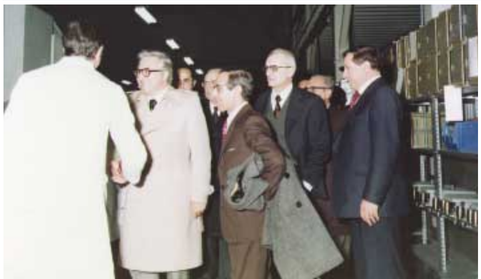
Visita all'Elsag del Ministro delle Poste e Telecomunicazioni Orlandi nel 1975. In primo piano, da destra: l'ing. Albareto, il prof. Rossi, l'ing. Sparatore e il Ministro